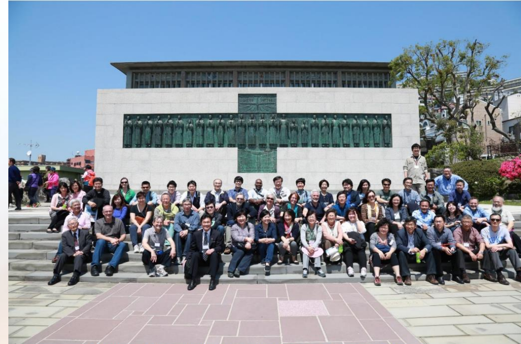
2015 Nagasaki Forum Participants during pilgrimage of pain and hope

Christian Forum for Reconciliation in Northeast Asia