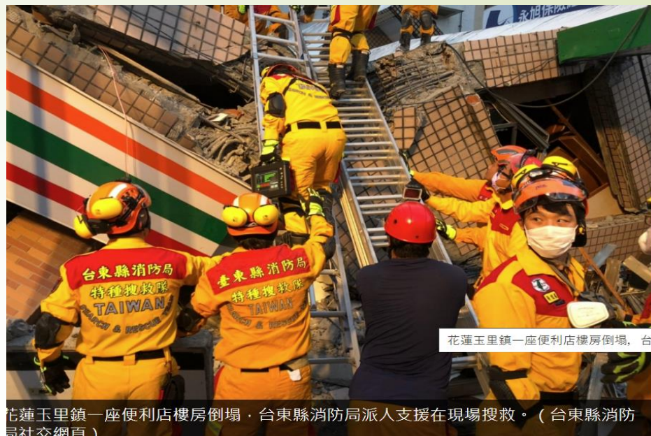
花蓮玉里鎮一座便利店樓房倒塌，台東